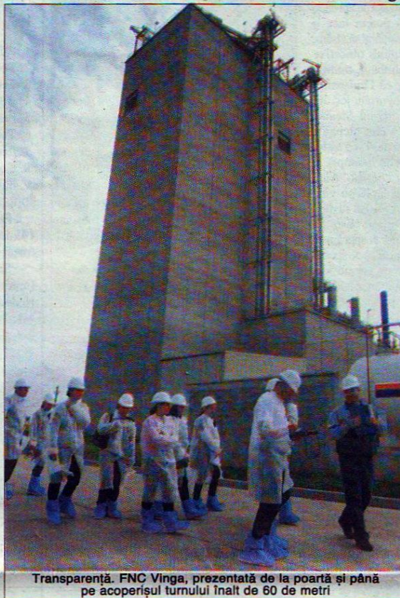
Transparentă. FNC Vinga, prezentată de la poartă și până pe acoperișul turnului înalt de 60 de metri

Deși în prezentarea noii fabrici au intrat, în descrierea companiei americane, proiectele sociale în valoare de 50.000 de euro din acest an (programe de responsabilitate so-